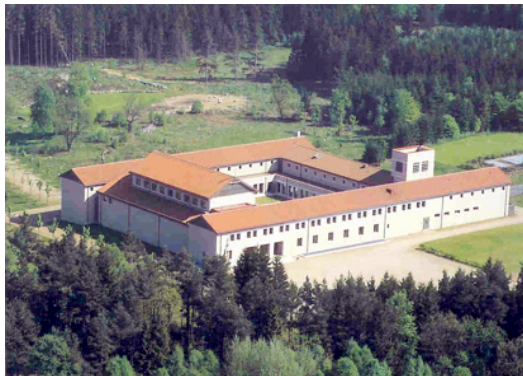
Jesu Moder Marias Kloster